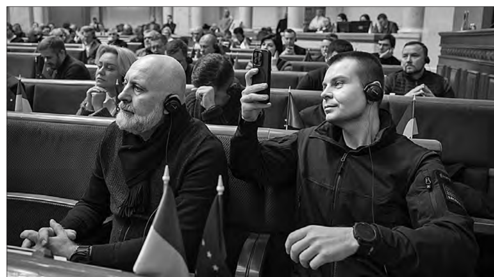
Під час засідання.

Міністерство оборони та Генеральний штаб, підтримавши законопроект, висловили сподівання на позитивне голосування в сесійній залі.