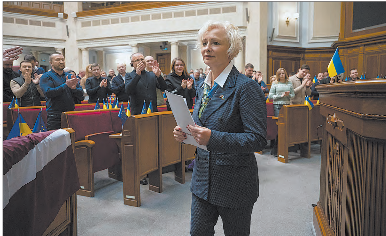
Більше фото тут — www.golos.com.ua